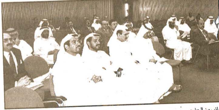
جانب من الحضور

السبل خاصة وان المتخصصين اصلا هم تجار واصدقاء واللجوء الى القضاء للفصل في المنازعات، قد يسفر عن مشاحنات بين المتقاضين. وبالنسبة لرجال القانون والمحامين فالندوة تفيدهم في كيفية الرجوع لملك الدعوى والتدقيق في بنود ونصوص الاتفاقيات اذا ما نصت العقود على التوفيق التحكيمي.